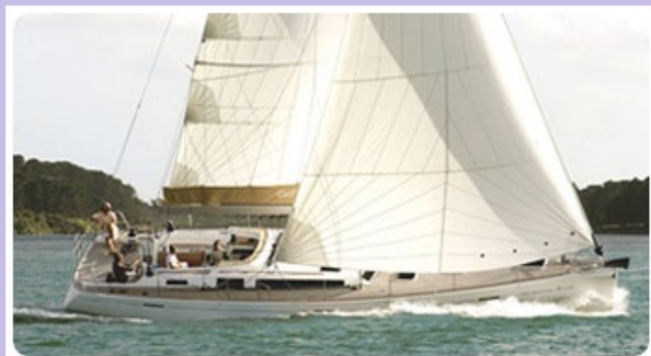
Dufour 525 Grand Large